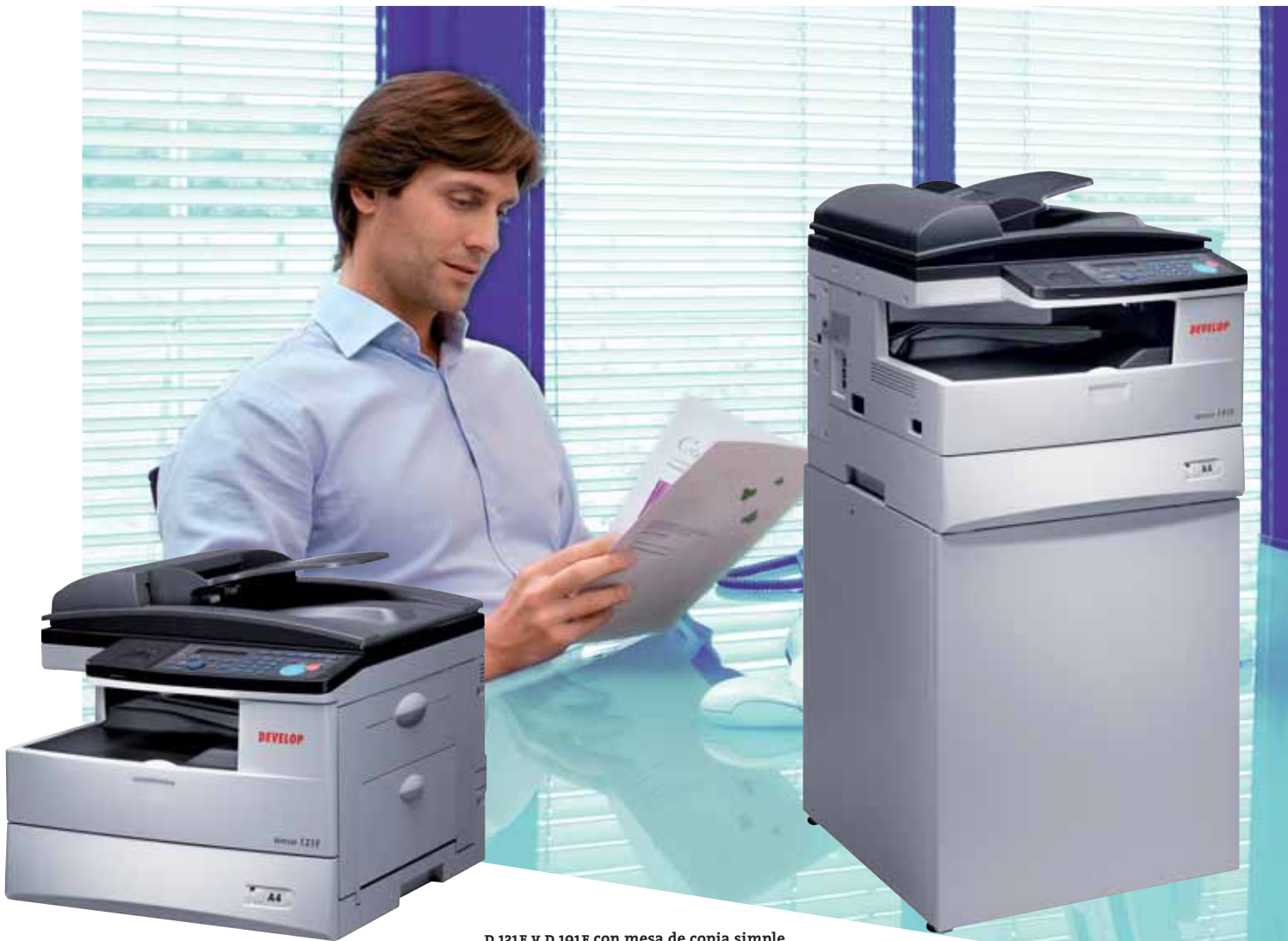
D 131F y D 191F con mesa de copia simple. Utilice esta todoterreno donde y como quiera: obtendrá beneficios de su inversión rápidamente.