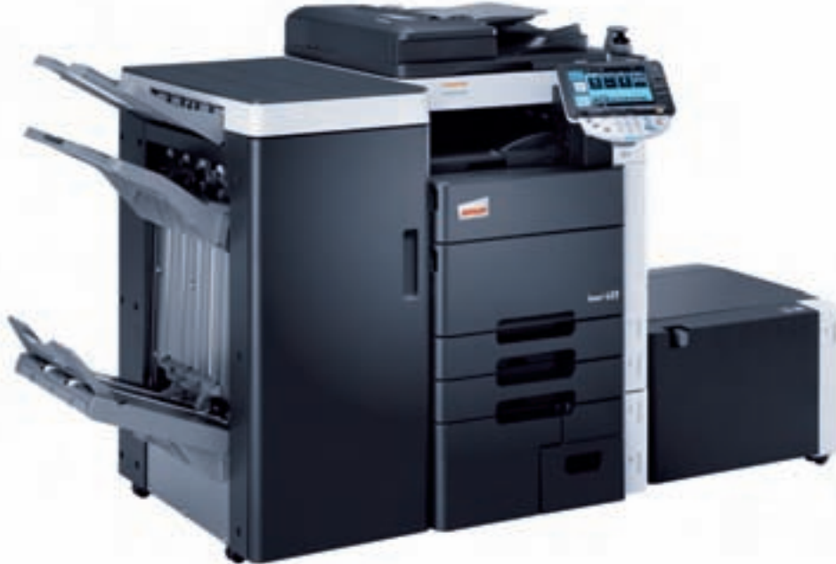
ineo+ 652 con finalizador grapador (FS-526), kit de plegado (SD-508), mesa de trabajo (WT-506), autenticación biométrica (AU-102) y bandeja papel de gran capacidad (LU-204)