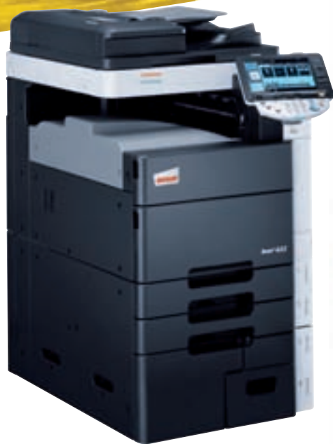
ineo+ 652 con bandeja de salida (OT-503)