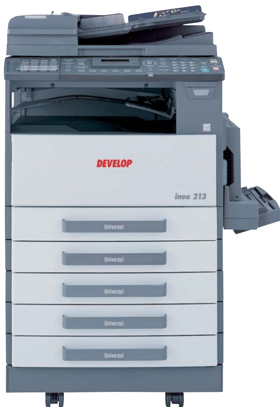
ineo 213 con alimentador reversor de originales DF-605, unidad dúplex AD-504, bandeja bypass múltiple MB-501 y soporte SCD-21 con cuatro cassettes de papel PF-502

La multifuncionalidad se considera a veces como una palabra negativa, porque muchos dispositivos multifuncionales optimizan la funcionalidad reduciendo al mínimo el rendimiento. Pero ineo 163/213 es muy diferente. Ofrece todas las ventajas de la multifuncionalidad sin afectar al rendimiento. Excelente impresión y fotocopiado GDI, redes y comunicaciones mejoradas, materiales de información compartidos y mayor productividad, facilidad de uso y bajos costes de mantenimiento, exactamente el tipo de ventajas que necesitan las oficinas pequeñas o domésticas.