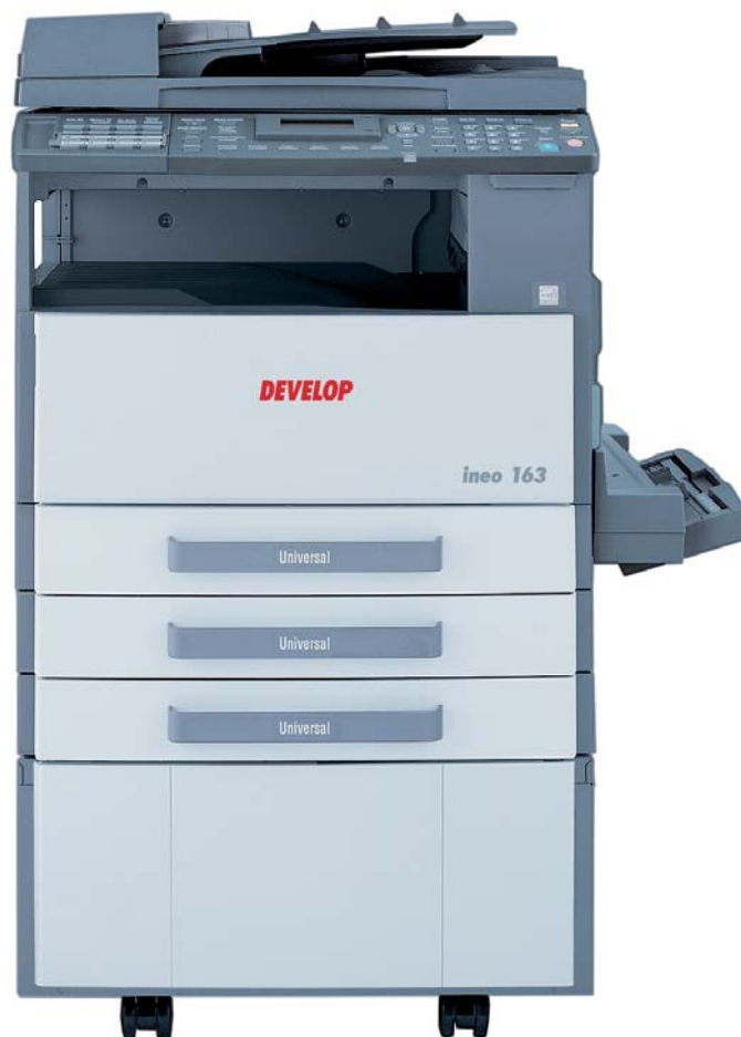
ineo 163 con alimentador de originales DF-502, bandeja bypass múltiple MB-501 y pequeño mueble SCD-21 con dos cassettes de papel PF-502

ineo 163/213 es la opción lógica para los trabajadores de pequeñas oficinas u oficinas domésticas, usuarios de fotocopadoras analógicas que necesiten más funcionalidades o usuarios de impresoras de chorro de tinta que quieran ahorrar tiempo y dinero, responsables de oficinas interesados en disponer de impresión y escaneado en red, y empresas de tamaño medio que busquen más que A4. Este dispositivo compacto y multifuncional les ofrece todo eso con una excelente relación calidad/precio.